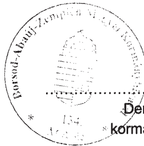
Demeter Ervin * kormány megbízott